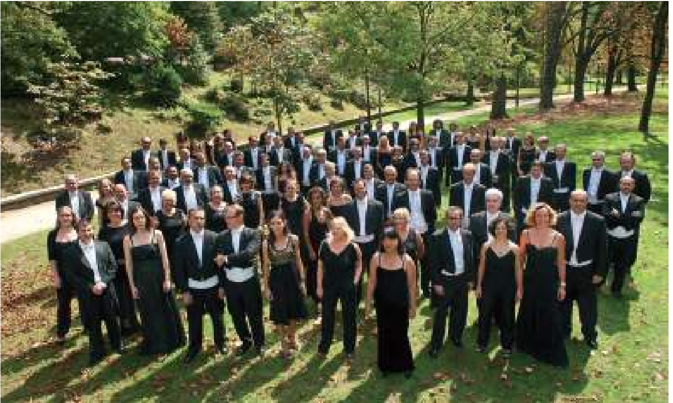
Euskadiko Orkestra Sinfonikoa / La Orquesta Sinfónica de Euskadi / The Basque National Orchestra.

años de existencia, lo que da fe de la importancia a nivel simbólico que concedió a la música. Su primer director fue Enrique Jordá, de reconocida trayectoria internacional, y en su relativamente breve existencia se ha convertido en una de las orquestas de referencia del Estado, con más de cien actuaciones al año, una temporada anual de abono en Bilbao, Pamplona, San Sebastián y Vitoria, siete mil abonados y una media de ciento cincuenta mil espectadores anuales. Además de esta cuádruple temporada, realiza numerosas giras por España y el exterior, alternando las obras de compositores vascos tanto pasados como contemporáneos, que son una de las principales preocupaciones de la orquesta, con los grandes nombres de la música universal. Sus interpretaciones han llenado algunas de las salas de conciertos más importantes del mundo, y su repertorio se ha visto reflejado también en más de cincuenta grabaciones discográficas, entre las que destacan los discos de la serie de compositores vascos, o los de las composiciones de Escudero, Lazkano o Illarramendi. Otras más atípicas son muestra de su arraigo social, como las grabaciones con Benito Lertxundi, los payasos Txi-