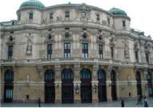
Bilboko Arriaga antzokia / Teatro Arriaga en Bilbao / The Arriaga Theatre in Bilbao.

Ilustrazioaren mugimenduarekin hasi zen aldatzen pixkanaka musika-giroa Euskal Herrian, eta Europako ereduari –bereziki Frantziakoei– jarraitu zitzaizkion hemen, musika modernizazio-bidean jartzeko ahaleginean. “Euskal Herriaren Adiskideen Elkarteak” izan zen mugimendu haren oinarria; lan handia egin zuen musikaren arloan, nahiz eta erlijioaren esparrutik kanpo jarduteagatik aurkako jarrera ugari izan zuen. Gau-ekitaldiak eskaini ohi zituzten, zaleentzako emanaldi erdi-publikoak eta operak ere bai. Gaur egun elitistatzat joko genukeen giro hartan jaio zen Juan Crisostomo Arriaga musikagilea, hamaika urterekin idatzi zuena bere lehenbiziko musika-lana. Hamabost urterekin, garai hartarako erabaki ezohikoa bezain arriskutsua hartuz, Parisera joan zen musika ikastera; onartu egin zuten hango kontserbatorioan, eta bertan irakasle izatera ere heldu zen. Hogei urte bete baino egun batzuk lehenago hil zen, eta haren heriotza goiztiarrarekin maisu handi bat izan zitekeena galdu zuen euskal musikak. Gaur egun ere Arriagaren sinfonia bakarra, hiru hari-kuartetuak eta Los Esclavos felices operaren obertura sarritan agertzen dira nazioarteko kontzertuen programetan. Arriagak eman dio izena ia mende oso batez Bilboko musika erudituen bihotza izan den antzokiari.