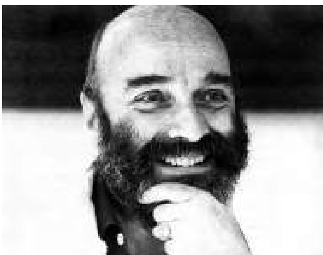
Luis de Pablo