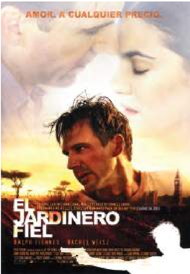
El jardinero fiel filmaren horma-irudia. Filmak Alberto Iglesiasen soinu-banda du / Cartel de El jardinero fiel , con banda sonora de Alberto Iglesias / Poster for The Constant Gardener , with soundtrack by Alberto Iglesias.