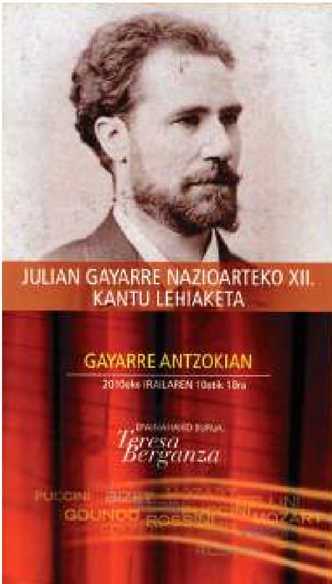
2010eko Julian Gaiarre Nazioarteko Kantu Lehiaketaren horma-irudia / Cartel de la edición de 2010 del Concurso Internacional Julián Gayarre / Poster for the 2010 edition of the Julián Gayarre International Singing Contest.

Horixe da Bilboko Elkarte Filarmonikoaren kasua; 1896an sortu zen, eta 1904az geroztik egoitza propioa du hirian, Portuko Markesaren kalean, kontzertuak egiteko. Kyrstian Zimerman pianista ospetsua Elkartearen ohorezko bazkidea da. Iruñeko Elkarte Filarmonikoa 1960an sortu zen, eta Iruñeko Baluarte auditorioan antolatzen ditu kontzertuak. Bada Bilbon beste elkarte garrantzitsu bat: ABAO-OLBE, Operaren Lagunen Bilboko Elkarte, eta honek ere lan bikaina egiten du opera ezagutarazteko eta zabaltzeko; 1953an sortu zen, eta babesleei eta bazkideei esker—sei milatik gora ditu— urte osoan zehar antolatzen ditu kontzertuak, Bilboko Euskalduna jauregian, zortzi opera desberdinekin.