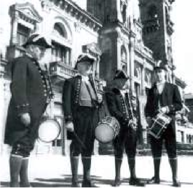
Donostiako udal txistulari- banda, galaz jantzita. Banda Municipal de Txistularis de San Sebastián, en traje de gala. Municipal Txistulari Band of Donostia, in ceremonial dress.

denboraldia ere eskaintzen du, noizean behin aparteko kontzertuak emateaz gainera.