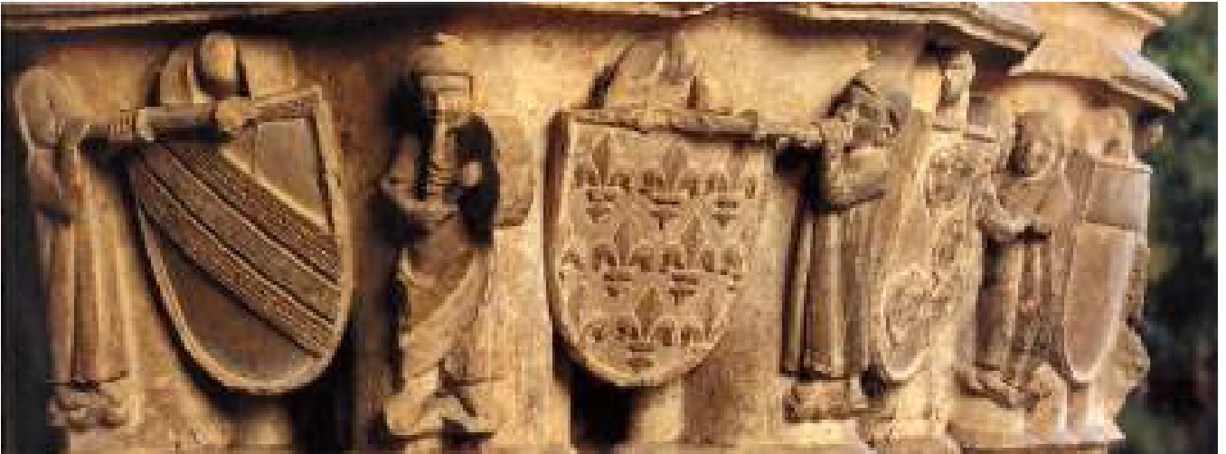
Tronpeta-, flauta- eta danbor-jotzaileak. Iruñeko katedraleko kapitela / Intérpretes de trompeta y de flauta y tambor. Capitel de la Catedral de Pamplona / Trumpeters, flute players and drummers. Capital in the Cathedral of Iruñea-Pamplona.

Como hemos indicado, la Historia de la Música erudita occidental transcurre en muy pocos países. En la Edad Media, el lugar privilegiado es Francia, cuya cercanía –especialmente a partir del siglo XIII, cuando el trono de Navarra fue ocupado por dinastías francesas– sitúa en la órbita vasca a alguno de los más sobresalientes compositores del periodo. Es el caso del primer monarca francés de Navarra, Teobaldo de Champaña, que con el nombre de Teobaldo I de Navarra es conocido hoy día como uno de los representantes más destacados del movimiento trovadoresco. De él se han conservado casi cincuenta melodías en más de quinientas versiones, hecho excepcional en el panorama de la época. Otro nombre que se emparenta con Navarra es el del quizás más importante compositor de toda la Edad Media, Guillaume de Machaut, que fue compositor de corte de Carlos II de Navarra.