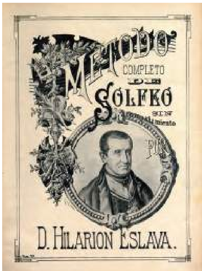
Hilarion Eslabaren solfeo-metodoa. Método de solfeo de Hilarión Eslava. Hilarión Eslava's Sol-Fa Method.

puesto como maestro de capilla en la Catedral de Sevilla por otros en principio peor remunerados en la capital de España, donde acabó siendo director del Conservatorio de Música, que reorganizó dándole una estructura casi tan duradera como su Método de Solfeo , con el que se han iniciado en la música generaciones enteras de españoles e hispanoamericanos.