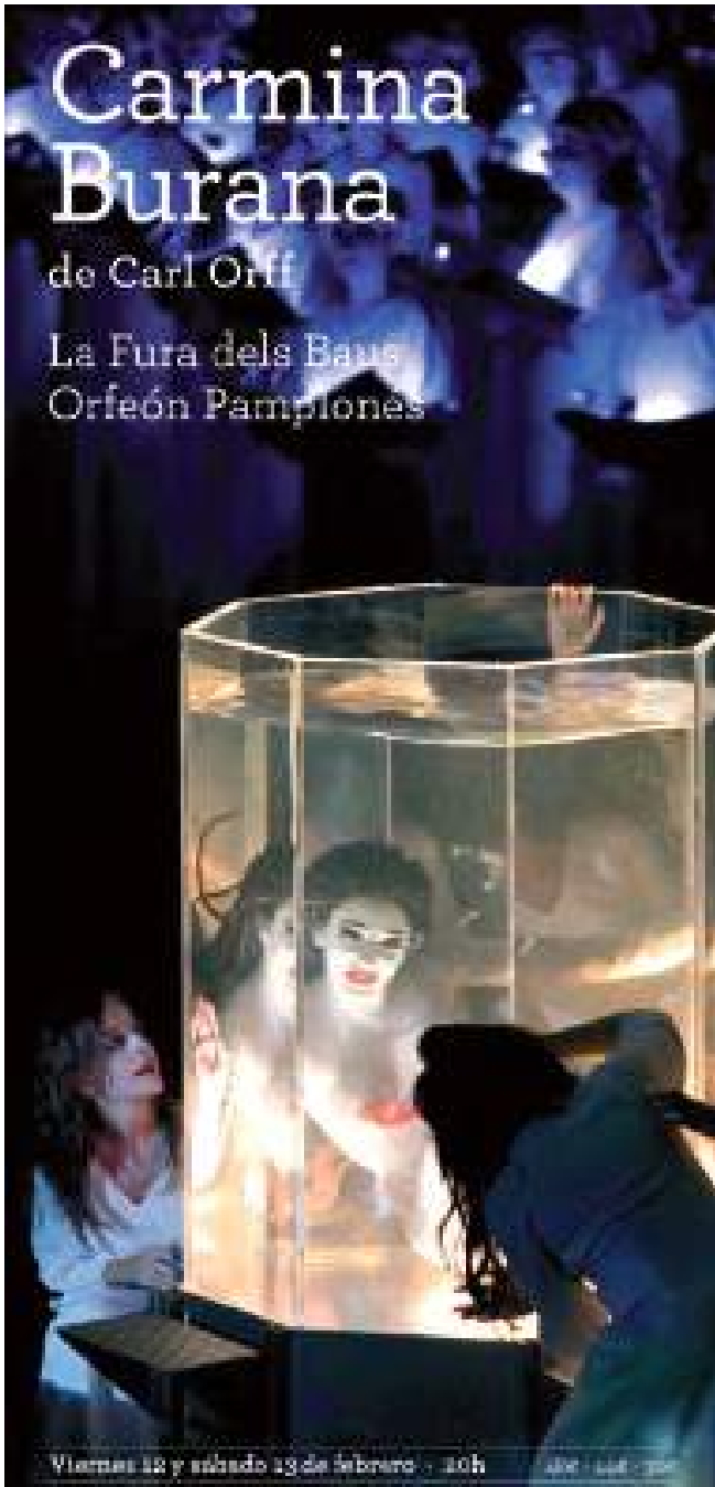
Carl Orffen Carmina Burana ren horma-irudia; La fura del baus taldearen, Nafarroako Orkestra Sinfonikoaren eta Iruñeko Orfeoiaren artean egin zen muntaia / Cartel del montaje de Carmina Burana , de Carl Orff, con el grupo La fura del baus, la Orquesta Sinfónica de Navarra y el Orfeón Pamplonés / Poster depicting the setting up of Carl Orff's Carmina Burana with the theatre group La fura del baus, the Nafarroa Symphony Orchestra and the Iruñea Choral Society.