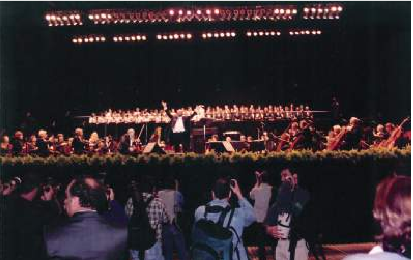
Bilboko Koral Elkartea Luciano Pavarottirekin, Athletic Cluben mendeurrenean, 1998ko apirilaren 25ean.

La Sociedad Coral de Bilbao en el centenario del Athletic Club, junto a Luciano Pavarotti, el 25 de abril de 1998.