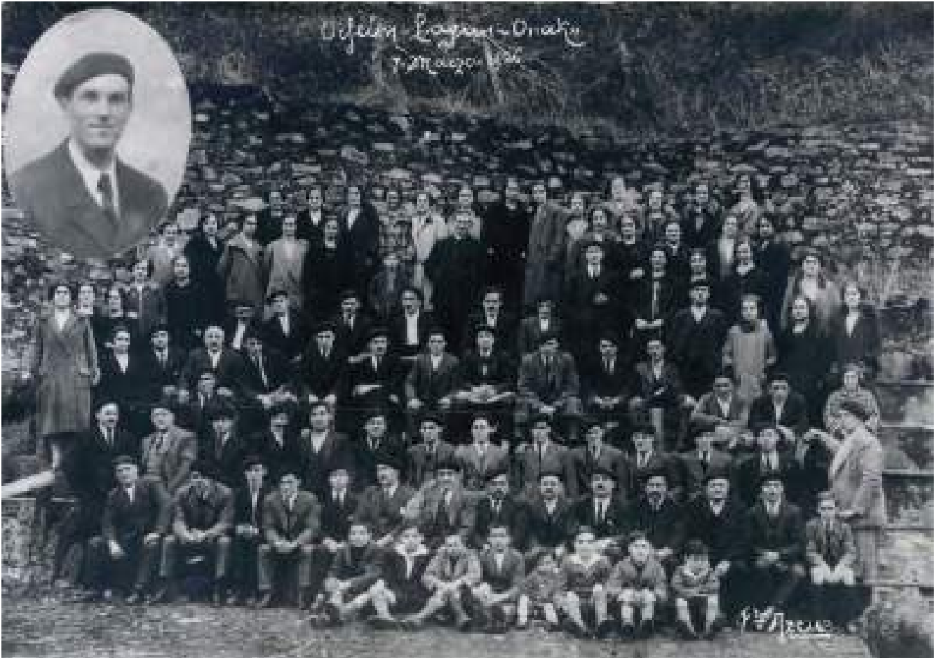
Iruñeko Orfeoia, 1926an / El Orfeoón Pamplonés en 1926 / The Orfeoón Pamplonés in 1926.