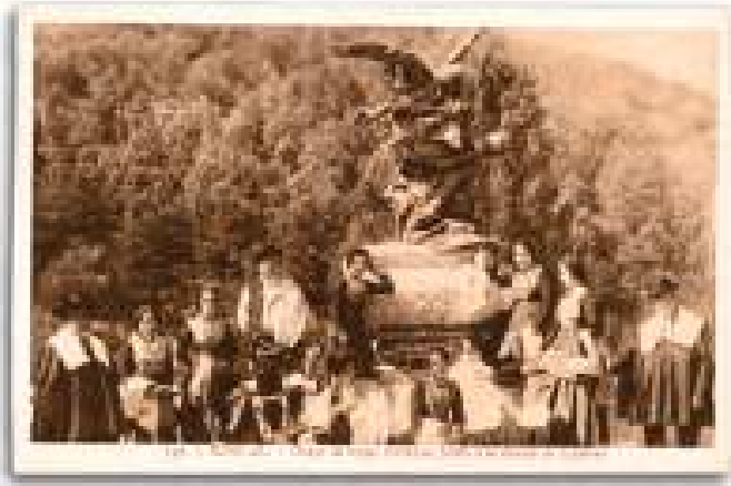
Julian Gaiarrereren oroitarria, Iruñea Monumento a Julián Gayarre en Pamplona Monument to Julián Gayarre in Iruñea

Ciertamente, entre ese reducido elenco de cantantes solistas de primera fila, también encontramos a un buen puñado de vascos, pese a que la infraestructura del País está a distancia más que considerable de la que tienen otros lugares como Alemania, Italia, Francia, Gran Bretaña, Estados Unidos o el norte y este de Europa, por poner algunos ejemplos.