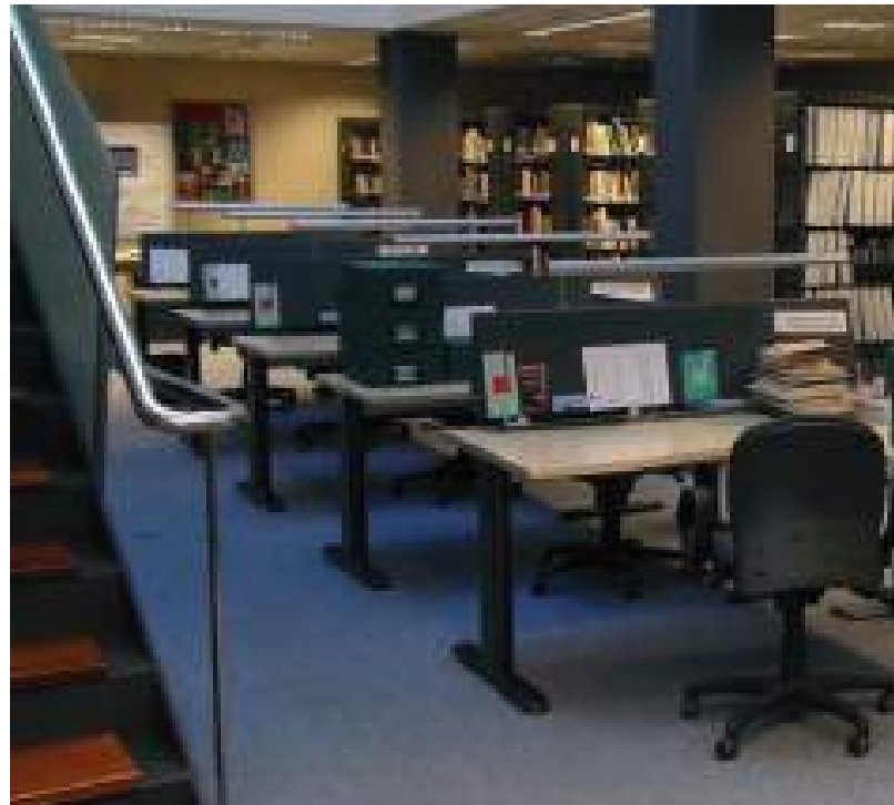
Eresbil elkartearen egoitza, Errenterian / Instalaciones de Eresbil, en Rentería / The Eresbil facilities in Errenteria.

rrera; eta harrezkero bi urtetik bi urtera egiten dira. Interpretatzaile gazteei hastapenetan laguntza eta bultzadatxo bat ematea da bi lehiaketa horien asmoa, baina, horrez gainera, badute beste helbururik ere: alde batetik, nazioarteko alor kulturean Nafarroari toki bat egitea, eta bestetik bi musikari nafarrak, Julian Gaiarre tenorra eta Pablo Sarasate biolin-jotzailea, mundu zabalean promozionatzea.