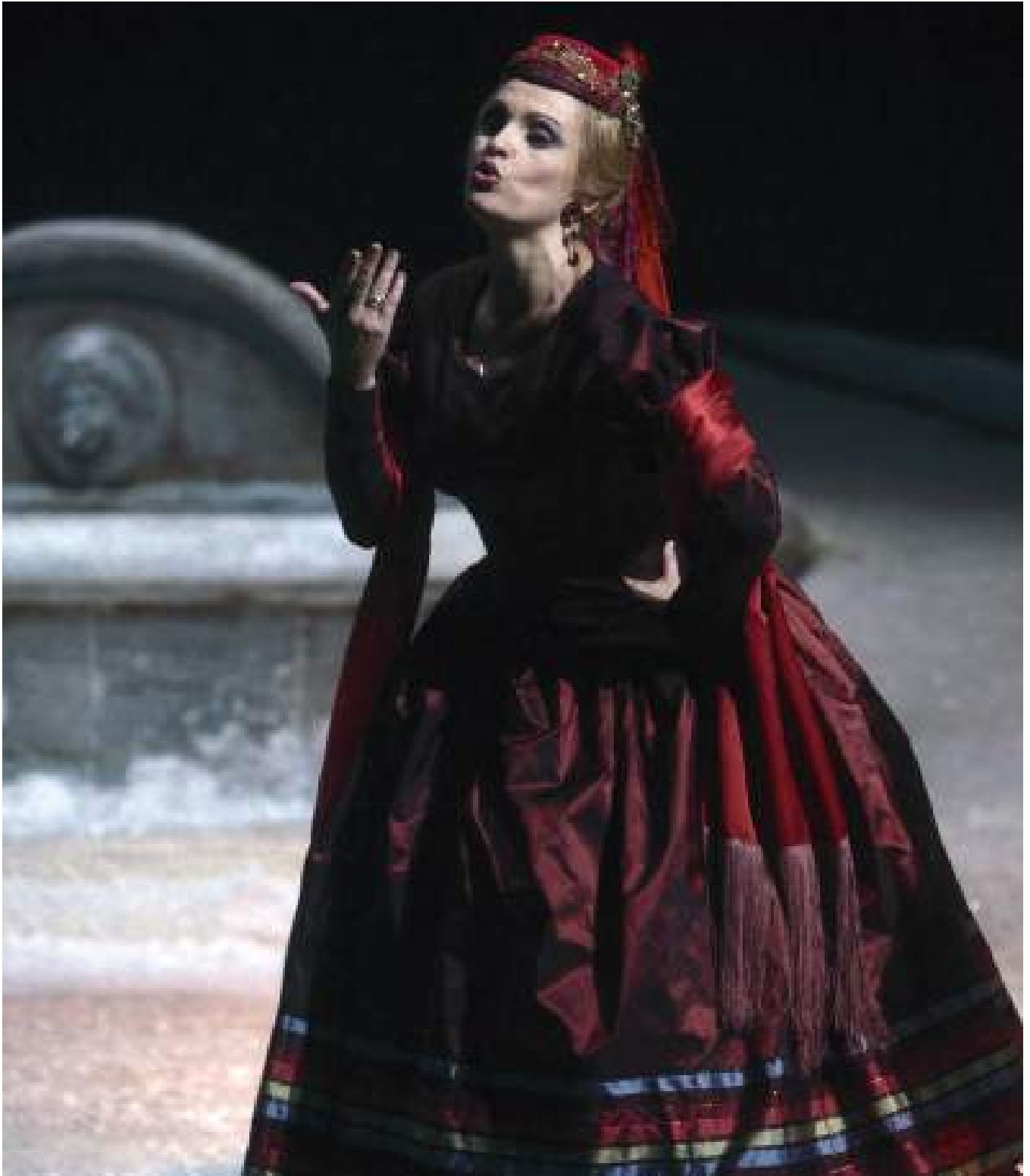
Ainhoa Arteta abesten / Ainhoa Arteta cantando / Ainhoa Arteta singing.