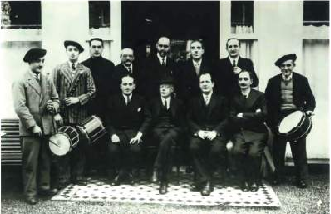
Béla Bartók Erreterian, garaiko euskal musikari aipagarrienetako zenbaitekin / Béla Bartók en Rentería, con varias de las figuras más relevantes de la música vasca del momento / Béla Bartók in Erretereria, with several of the most prominent figures in Basque music at that time.

gehiago iraun baitu, eta Espainiako eta Hego Amerikako belaunaldi askorentzat gidaliburua izan baita musikan lehenengo urratsak emateko.