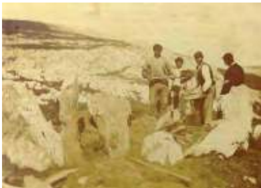
Telesforo Aranzadi, Jose Migel Barandiaran eta Enrique Eguren, euskal arkeologiaren aitak / Telesforo Aranzadi, José Miguel Barandiarán y Enrique Eguren, padres de la arqueología vasca / Telesforo Aranzadi, Jose Miguel Barandiaran and Enrique Eguren, fathers of Basque archaeology.

kaldunen markatzaile genetikoetan edota euskal populazioaren barruan ez zegoela bariazio genetiko handirik.