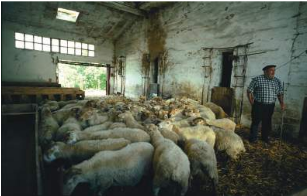
Artaldea artegian / Un rebaño de ovejas en el establo / A flock of sheep in a barn.

bizitzeko behar zen guztia; ez zegoen azokara joan beharrik gauzak erostera. Dieta sinplea zen: zopa, taloak eta morokilak, ahia, esnea, esnekiak, babarrunak eta oso aldian behin okela. Oinarritzko janariak hiru ziren: gaztainak (erreta jaten zirenak edo pure eginda zopan), taloak eta babarrunak. Janari horiek guztiak baserrian bertan egiten ziren. Edari nagusiak esnea eta sagardoa ziren, eta horiek ere etxean egiten ziren. Baserriak beste janari batzuk ere ematen zituen: eztia, azukrearen ordez erabiltzen zena, fruituak eta haragia, txerriak batez ere. Urtean behin txerri bat hiltzen zuten; gero, haren haragia ontzen jarri eta urte osoan irauten zuten.