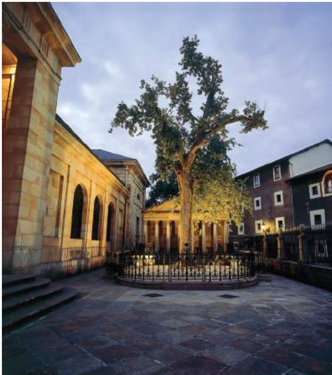
Gernikako arbola / Árbol de Gernika / The tree of Gernika.