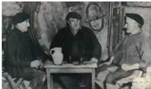
Bertsolariak sagardotegian / Bersolaris en una sidrería / Bertsolaris in a cider house.

Es la combinación del arte verbal, la actuación, la creatividad textual y la voz social aquello que dota a