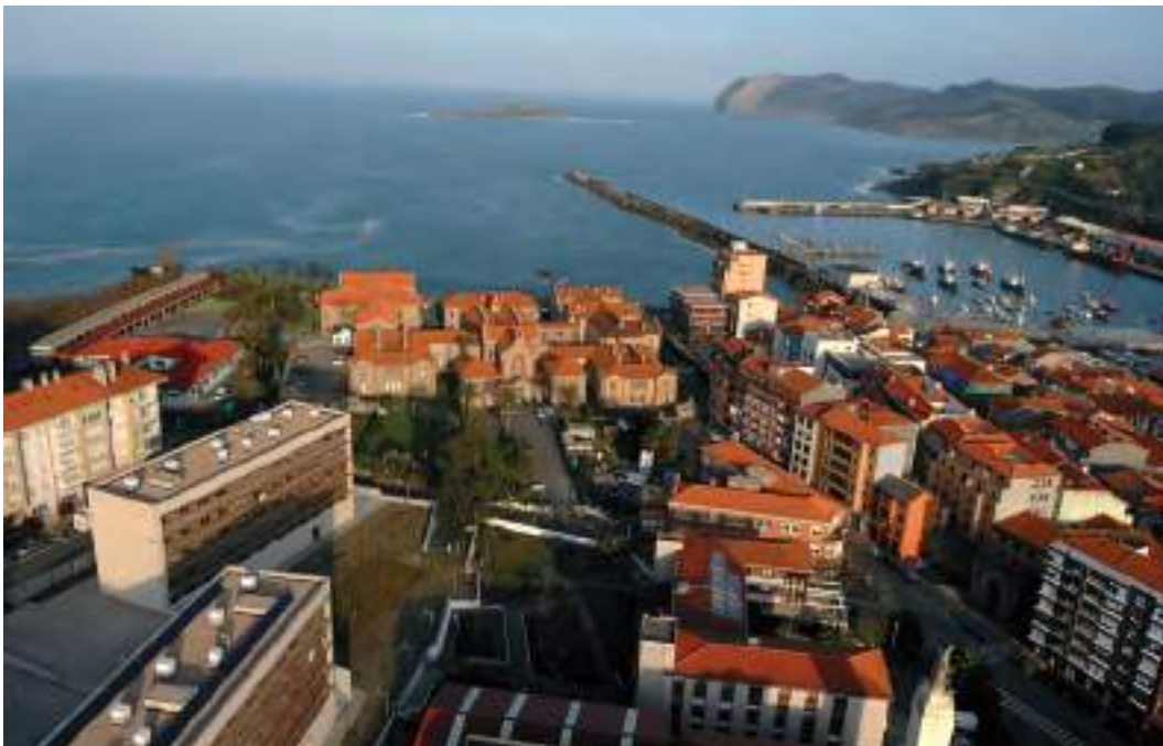
Bermeo / El pueblo vizcaíno de Bermeo / Bermeo, in Bizkaia.

zunak. Normalean, emakumeek gobernatzen dute etxea; beraiek eramaten dituzte diru-kontuak eta beraiek ezartzen dituzte familiaren lehentasunak. Hori dela-eta, emakume zailduak izaten dira, nortasun handikoak, oztopoak oztopo beti aurrera egiten dutenak. Adibidez, euskal gizartean, emakume bat “kasta gogorrekoa” edo izaeraz menperatzailea dela adierazteko, “Bermeokoa” ematen duela esaten da. Arrantzalearen emaztea gogorra eta bere buruarengan konfiantza handia duena bada, senarra justu kontrakoa izaten da. Urtean denborarik gehiena etxetik kanpo igarotzen du, eta harreman estuak ditu barkuko beste marinelekin, baita lehorrean direnean ere; etxean, ordea, bigarren mailako papera du eta ia ez du “agintzen”, bere etxean arrotza dela ez esatearren.