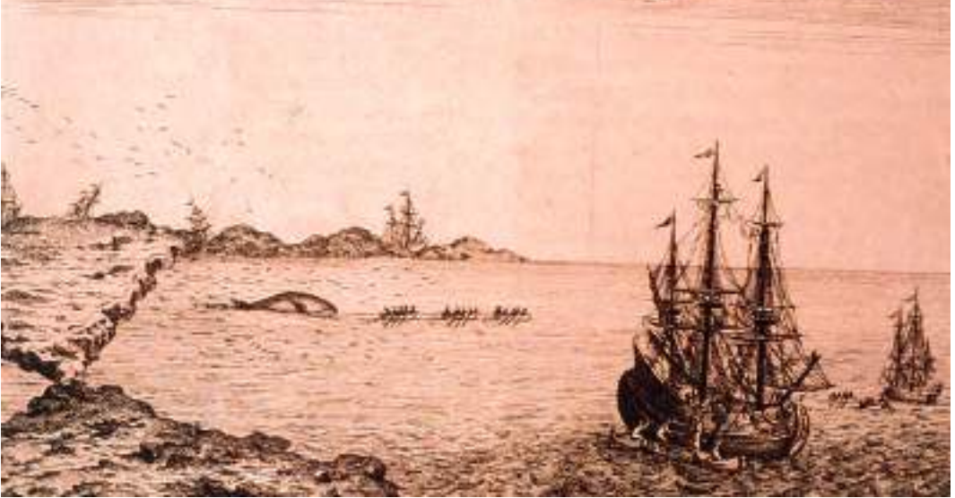
XV. mendeko balea-arrantzaren ilustrazioa / Ilustración de la caza de ballenas del siglo XV / Illustration of whaling in the 15th century.

En el País Vasco, al igual que en gran parte de la Europa rural, la pesca es una alternativa a la agricultura, en lugar de ser un estilo de vida complementario. Esto es cierto, aunque la comunidad costera bien puede contener agricultores ( baserritarrak ) así como pescadores ( arrantzaleak ), puesto que los dos sectores representan marcadamente modos de vida distintivos.