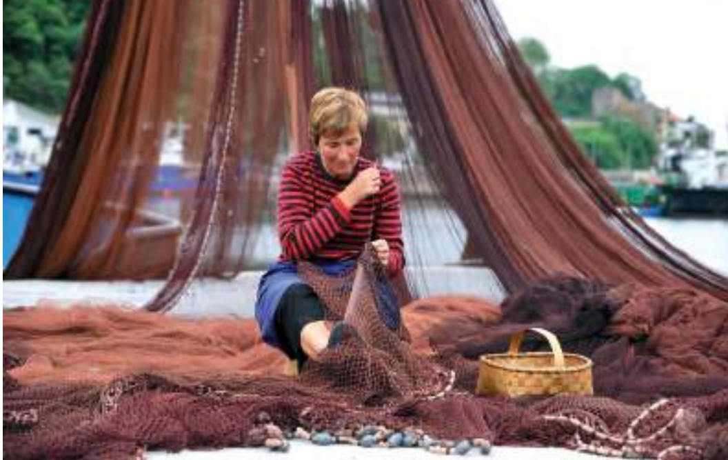
Emakumea arrantza-sarea konpontzen / Una mujer repara la red de pesca / Woman repairing fishing net.

bizimodura egokitzeko, eta beren seme-alabak ia aita ikusi gabe hazten dira, haren eredurik eta eraginik jaso gabe kasik. Baina arrantzaleak ezin du bizi itsasorik gabe, sarerik gabe, zoriarekin tirabira liluragarrian jolasean ibili gabe. Kontraesan etengabean bizi da: itsasoan dagoenean, etxea dauka gogoan, eta etxean dagoenean, itsasoa buruan. Horrenbestez, dagoen tokian dagoela, urrun sentitzen da beti; burua nahastua sentitzen du eta alienazioa ere paira dezake. Atzerriko portu batean marinelak moral sexual bikoitza erakuts dezake: bere iritzira, ez da onartzekoa inola ere emazteak beste gizon batekin amodio-harremarik izatea, bera itsasoan dagoen bitartean; baina "ulergarria" da bera prostituzio-etxeetara joatea, etxetik urrun dagoenean. Moral bikoitz horren arabera, prostituta batekin joateak sexu beharrak asetzea beste helbururik ez du, hor ez dago bestelako inplikaziorik, eta ez dauka zerikusirik harremanekin eta afektuekin. Era berean, bereizi egiten da fideltasun eza atzerriko portu batean eta etxean; lehenengoa barkagarria da; bigarrena ez.