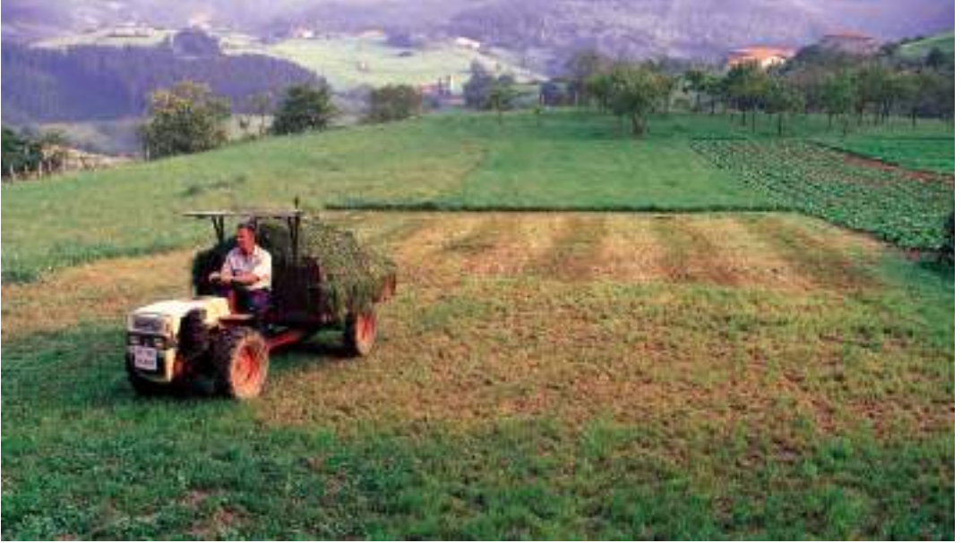
Belar moztu berria traktorean biltzen / Recogiendo en el tractor la hierba recién cortada / Gathering recently mowed grass by tractor.

tario y su mujer eligen de entre su descendencia a un único heredero del caserío. En muchos lugares del País Vasco esta selección viene determinada por el primogénito varón; sin embargo, hay muchas excepciones. Asimismo, se supone que los hermanos del heredero seleccionado deben irse. Tradicionalmente, sus opciones eran casarse con miembros de otras explotaciones agrarias cercanas, entrar en el clero, emigrar a zonas urbanas o bien emigrar a otros países.