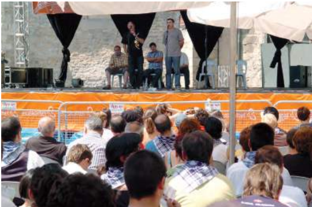
Bertso-jaialdia / Festival de bersolaris / Bertsolari festival.

tsitatean ikasitakoak, eta tartean badira literatura idazten dutenak ere. Bertsolari zaharrak gizonezkoak ziren denak –XV. mendean, emakumezko bertsolariak bazirela aipatzen da, hala ere–. Alderdi horretatik ere gauzak asko aldatu dira azkeneko urteotan, gaur egun gero eta emakume gehiago ikusten baitira plazetan bertso kantari. Lau urtez behin jokutzen da bertsolarien txapelketa nagusia, eta 2009. urtekoan, emakumezko batek irabazi zuen txapela.