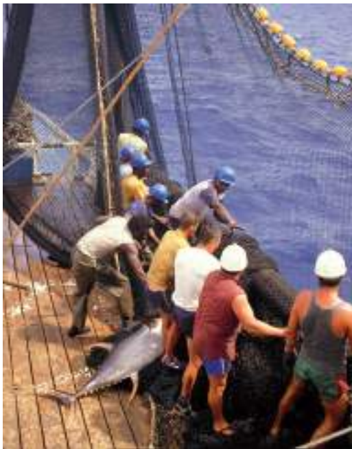
Atunaren arrantza / Pesca del atún / Tuna fishing.

zioarteko merkataritza-sareetan erabat murgilduta zegoela Erdi Aroan. Itsasgizon gazte batek lan egin zezakeen Espainiako edo atzerriko itsas enpresetako barkuetan edota sar zitekeen marinela itsas armadan erregearen zerbitzura. Arrantzalea bazen, berriz, herriko arrantzale-kofradiako kide izango zen, eta seguruenik Ternuako kanpainetan ere partu hartuko zuen. Herrian zegoenean, egunero aterako zen arrantzara, eta harrapatutako arrainak saldu egingo zituen, etxerako behar zituenak apartatu ondoren; arrainak Iruñera eta Madrilera bidaliko ziren gero, eta baita urrutirago ere.