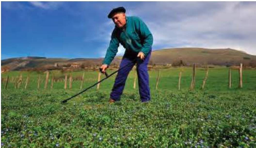
Baserritarra segan / Un campesino segando / A farmer cutting grass with a sega (scythe).

Belazeek ganadua mantentzeko bazka ematen dute. Belar berdea pilatuz, metak egiten dira, belarra ondu eta kontserba dadin; eta gero, neguan, bazkarik ez dagoenean, belar ondu hori ematen zaie aziendei. Belazeak garrantzi handikoak dira baserriaren ekonomiarako; zenbat belar izan, hainbat behi hazi baitaiteke, eta baserri baten balioa dauzkan behi-buruen arabera neurtzen da. Fruta-arbolak ere izaten ditu baserriak: sagarrak, udareak, mertxikak, haranak, gezeziak, pikuak, intxaurrek eta gaztainak –adierazgarria da euskaraz fruituaren izenak arbola izendatzeko ere balio izatea–. Animaliei ere ematen zaizkie fruituak. Mendiko lursailetan basoak egoten dira (egurra sutarako, basafruituak eta eraikuntzarako materialak ematen dituzte), garo-sailak (ganaduaren azpiak egiteko erabiltzen da garoa edo ira, eta gero simaurra ateratzen da hortik, lurra ongarrizteko) eta larreak (aziendak bazkatzeko, ardiak batez ere). Baserritarrak zikloen eta urtaroen arabera neurtzen du denbora. Lurra lantzeko zikloa udaberrian hasten da. Apirilaren bukaeran artoa egiteko prestatu behar