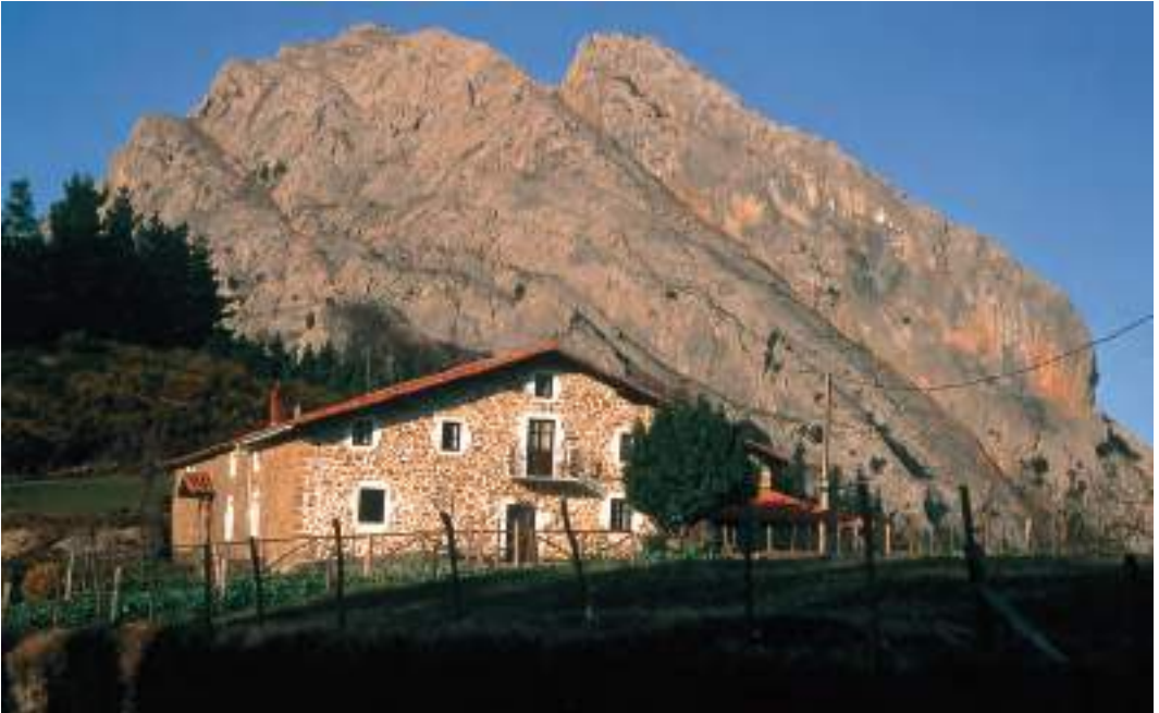
Baserrí bat / Un caserío / A baserri farmstead.

La sociedad vasca tradicional está anclada en la institución de la explotación agraria del caserío. Se trata de un objeto de estudio popular por parte de folcloristas y antropólogos. Aunque su relevancia económica actual es insignificante, su trascendencia histórica y cultural es mucho mayor.