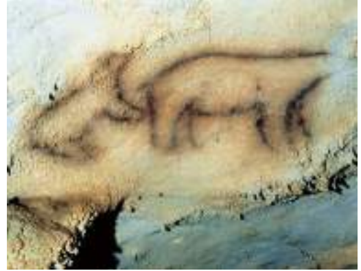
Ekaingo kobazuloko margoak / Pinturas de la cueva de Ekain / Paintings of the cave of Ekain.