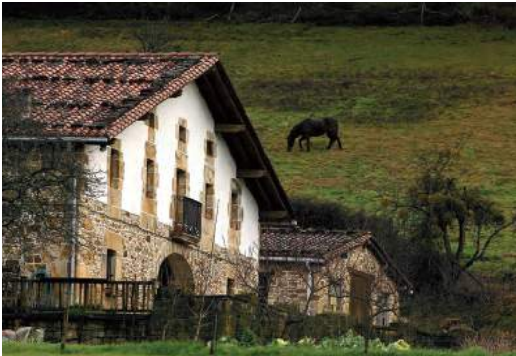
Baserria / Un caserío / A baserri farmstead.

berezia edukitzen da auzorik hurrenarekin, “lehen auzoa”rekin (ondoko baserrikoekin, alegia)–, hur-bilen dauden hiruzpalau etxeekin eta auzoko beste baserri guztiekin. Ohitura zaharrear, etxe bakoitzak lehen auzoaren beharra zeukan premiazko obligazio eta eginbeharretarako; larrialdietarako, adibidez. Ez-beharren bat sortzen zenean, lehen auzoari ematen zitzaion, kanpoko beste inori baino lehen, berria. Etxean norbait hiltzen zenean, lehen auzoak ematen zien heriotzaren berri apaizari eta agintari zibilei; bera arduratzen zen hiletaz eta zerraldoaz, eta bera jartzen zen harremanetan hildakoaren familiako senideekin. Aurreneko dolu-egunetan, lehen auzoak bere gain hartzen zituen zendutakoaren baserriko lanak. Lehen auzoarekin edo auzo hurkoarekin harremanen garrantzia esaera zaharretan eta atsotitzetan ere jasotzen da; batzuetan senideen aurretik ere