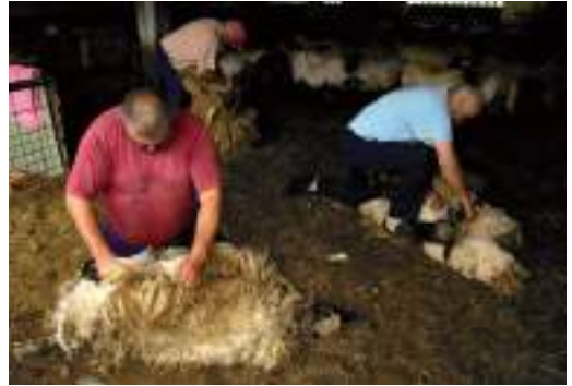
Ardiei ilea mozten / Esquilando ovejas / Shearing sheep.

Animals are a major source for games and metaphors in traditional culture. How a society deals with animals is revelatory of a cultural worldview. In many of the world's cultures, the definition of humanity is in opposition to animality. The millennia-old activity of hunting, and more recently animal husbandry, both underscore the singular relevance of animals in the human experience.