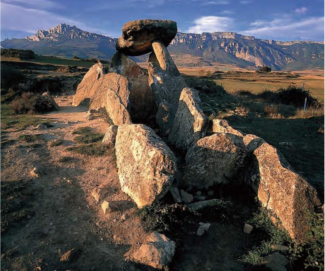
Trikuharri bat, Euskal Herriko mendietan / Uno de los dólmenes que se encuentran en los montes del País Vasco / A dolmen in the mountains of the Basque Country.

gigarria”, hau da, objektuetan egiten zena. Adituek historiaurreko artea estiloen, materialen, gaien, tekniken eta asoziazioen arabera sailkatzen dute. Motiboen artean, animalia eta gizakien irudiak daude eta baita interpretatzeko zailak edo ezinezkoak diren diseinuak ere. Labar-artean, honako animalia hauen irudiak agertzen dira hormetan pintatuta: oreinak, zaldiak, bisontek, arrainak, ahuntzak, hartzak eta txoriak. Haitzuloetako pinturek espekulazio akademikorako bidea eman dute askotan. Irudi ez-figurati- boen artean, badira forma sinple luzexkakoak; forma linealekoak, haginez apainduak; V formakoak; izar edo X itxurakoak; arku formakoak; lerro zuzenez osa-